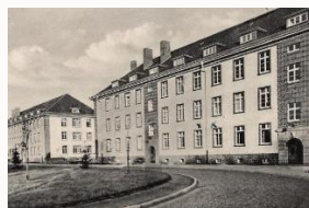
Ab 1994 Sitz in der Scharnhorst-Kaserne Bremen bis 31.03.2014